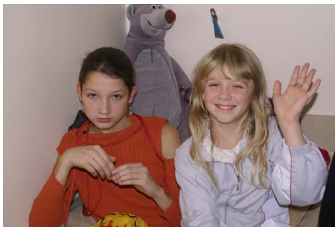
Flickor på Dianas gatubarnscenter

På vår hemsida: www.ak.se kommer mer information om resan liksom alla våra sponsorer att finnas.