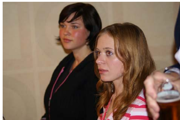
Ungdomar från Kopa ar Mums på middag på Hotel Riga