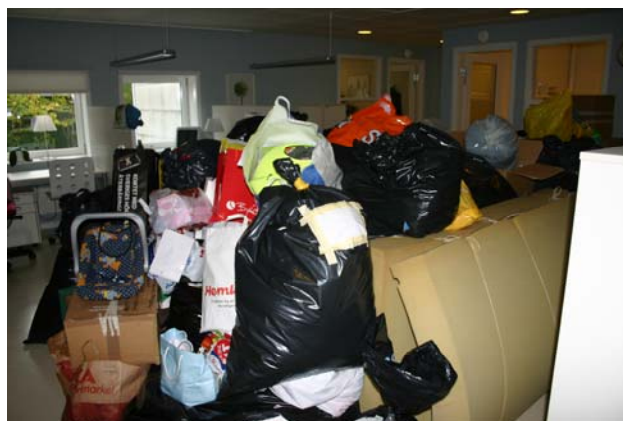
Insamling hösten 2007