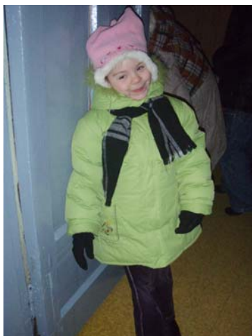
Liten flicka i Lauveri