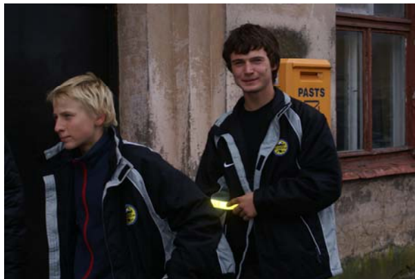
Nya jackor till Noa-barnen